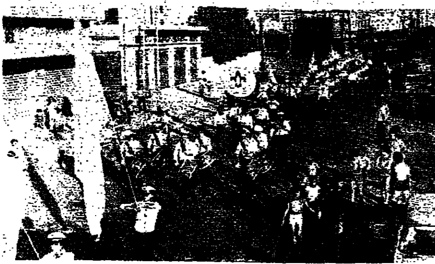
الكشافة تشارك في اسبوع التوعية الصحية والنظافة والسير في ميناء طرابلس